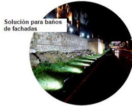
Solución para baños de fachadas