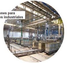
Soluciones para entornos industriales

LEC, Light Environment Control, es la primera fábrica de luminarias LEDs de Andalucía. Ubicada en Barbate (Cádiz) en 2.007 se convirtió en la primera empresa de Europa en iluminar una ciudad con tecnología LED telegestionada y en 2.011 ha recibido el premio a la innovación de la Universidad de Sevilla.