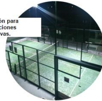
Solución para instalaciones deportivas.